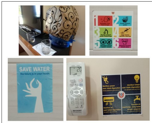
Gambar 1. Bukti komitmen implementasi Prinsip Lingkungan.

Secara detail, beberapa hal yang masih perlu diprioritaskan untuk ditingkatkan dan dikembangkan adalah sebagai berikut :